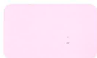
BELLS OF HOLLAND