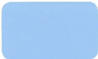
CORNER CUPBOARD 1010