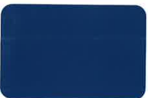
Wira Blue RC 2536