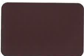
Istana Maroon RC 2542