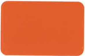
Orange RC 2537